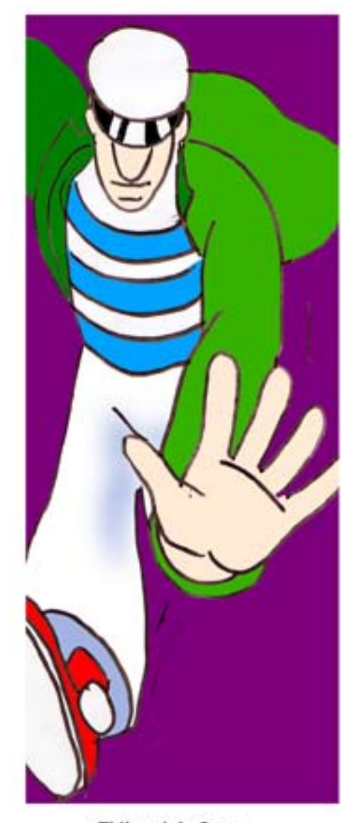
Thibaud de Corta